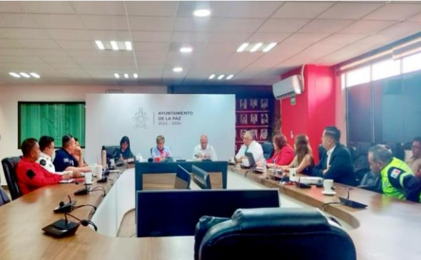
LUGAR: LOS REYES LA PAZ