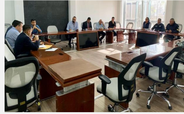
LUGAR: VÍA ZOOM METEPEC