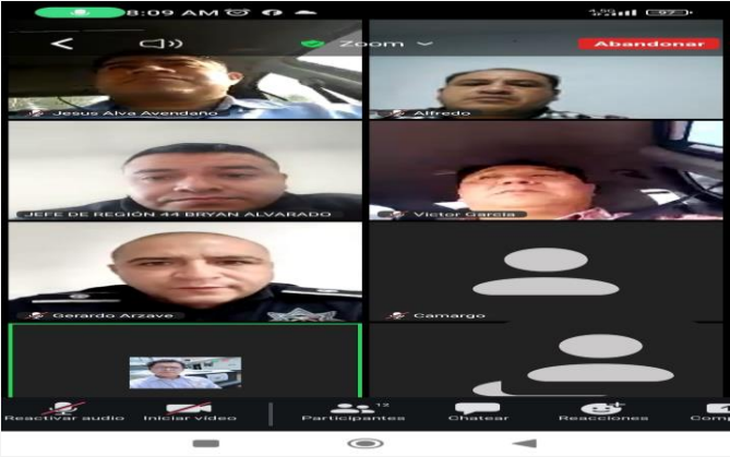
LUGAR: VÍA ZOOM, TEOTIHUACÁN