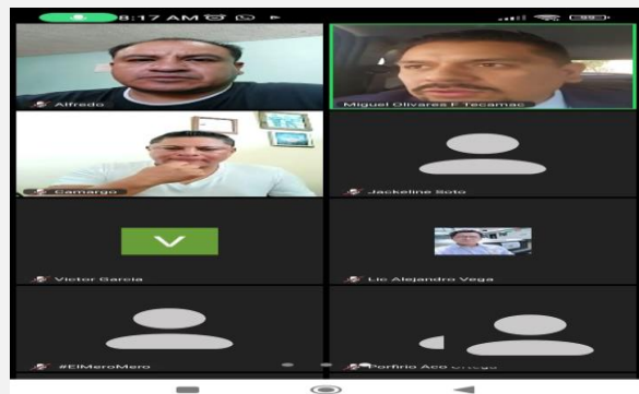
LUGAR: VÍA ZOOM, TEOTIHUACÁN