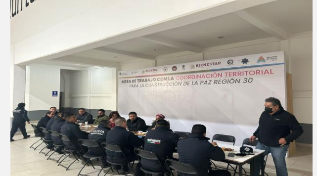
LUGAR: ALMOLOYA DE JUÁREZ