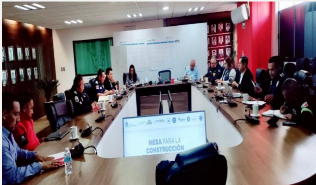
LUGAR: LA PAZ