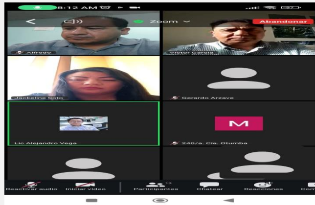
LUGAR: PAPALOTLA VÍA ZOOM