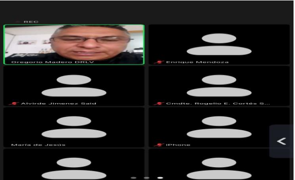
LUGAR: METEPEC VÍA ZOOM