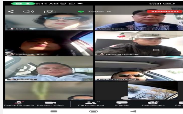
LUGAR: TEOTIHUACÁN VÍA ZOOM