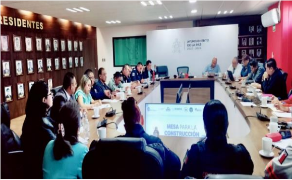
LUGAR: LA PAZ