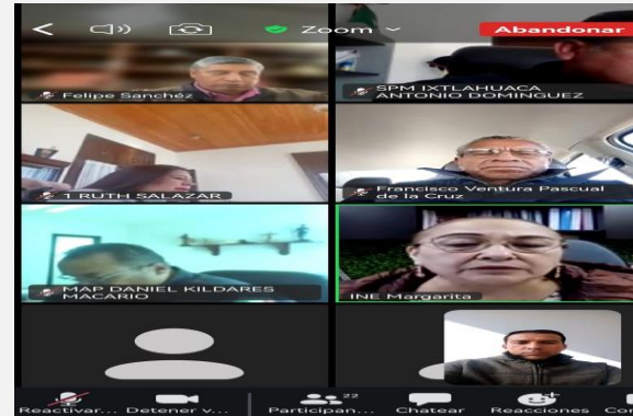
LUGAR: ATLACOMULCO VÍA ZOOM