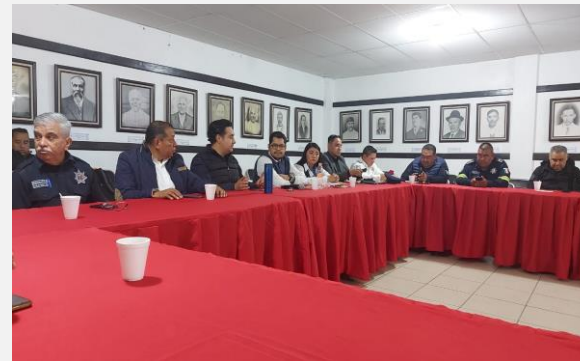
LUGAR: SAN MARTÍN DE LAS PIRÁMIDES