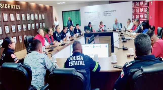
LUGAR: LA PAZ