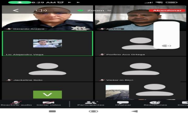
LUGAR: TEOTIHUACÁN VÍA ZOOM